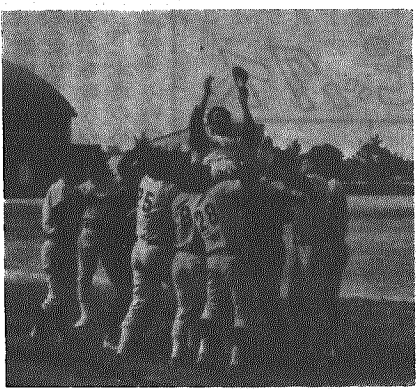
優勝でナインを扇上げる沢海好球ク

今年の早起き 野球大会は、天 候に恵まれ、参 加二十八チーム で連日熱戦がく りひろげられま した。 決勝に残った 両チームは、こ れまで一回ずつ 優勝している実 力者同士で、決 勝戦は、いつも