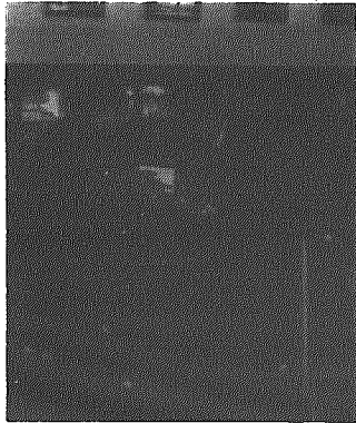
村長から表彰をうける自治功労者