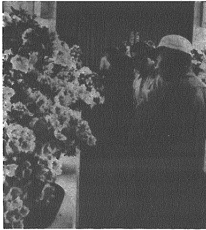
▲ さつきの愛好者は年々増えて、訪れる人も多い