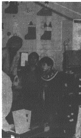
なかなかよいできたぞ

昭和二十三年 十二月十日の国 連総会で世界人 権宣言が採択さ れ、以来毎年、 人権についての 理解と意識を高 めるため、この 日を「人権デー 」と定めています。 私たちは、幸福で生きがい のある生活をしたいと願って いますが、そのためにどうし ても欠かせないのが「人権」 です。 つまり、「人権」はすべて の人が、生まれながらにして 持っている能力を、日々の生 活の中で十分に生かし、より