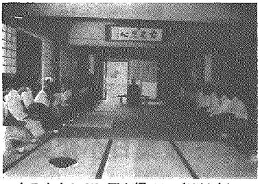
寺の由来などに耳を傾ける(法幢寺)

農協 納涼カラオケ大会 盆おどり 横越農協では、組合員と地域の交流と親睦を図るため、左記に納涼カラオケ、盆おどり大会を行います。 夏の夜のひとときをお楽しみください。 日時 八月十八日 夜 七時~八時 カラオケ 八時~十時 盆おどり 場所 農協本所前