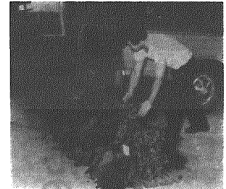
きれいにたばねられ出荷

昨年十月完成した藤駒野菜集出荷場は、六月二十六日から特産の枝豆の共同出荷が始まりました。枝豆は、十九戸の農家から一日平均一・五トが集荷され、亀田町の卸売業者に出荷しており、品質も良く市場の評判も上々とのことです。 これからも枝豆の出荷をめぐっています。