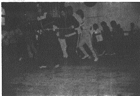
屋内でも結構楽しいよ