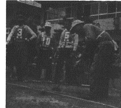
ゲートボールもお年寄りにとって大切なコミュニケーションの場

60年には 総人口の14%に 昭和五十五年国勢調査によると、横越村の人口は、八、五八六となり三十年ぶりに増加しました。ところで、六十五才以上の高齢者人口は、一〇三四人で総人口の二・一％をしめ、二十年前より一・六倍も増加しています。ことに昭和四十五年から急増のカーブを描き