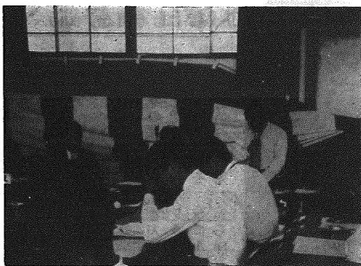
商工会館の建設が決議された総会

横越村商工会第八回通常総会が、五月二十五日公民館で開催されました。総会の主要議案は、商工会館の建設決議案のほか、昭和五十六年度事業・収支決算、昭和五十七年度事業計画・収支予算算などで、何れも原案どおり満場一致可決されました。今回決議された会館建設は、商工会の象徴であり会員が待望していたもので、昨年会館建設委員会を発足。先進地視察や審議を重ねた結果、会員の理解協力があってこれが具