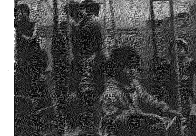
公園で元気で遊ぶ子供達

しよいか。乾いた道路での必要な車間距離は、時速40kmで40m、50kmで50m、60kmでは60mといわれていますが、濡れた道路ではとてもこれでは足りません。特に雨の降り始めた時は滑りやすく、したがって、車間距離もふだんの二倍はとるように心がけましょう。