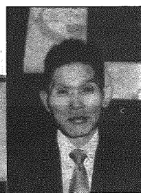
▲他の分館に負けない、活動をしたいと語る三沢分館長