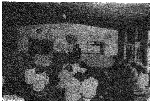
ひまわり教室開所式

昨年度、村の新しい事業として開所した療育指導のひまわり教室は、村内外から注目を集めてきましたが、今年度