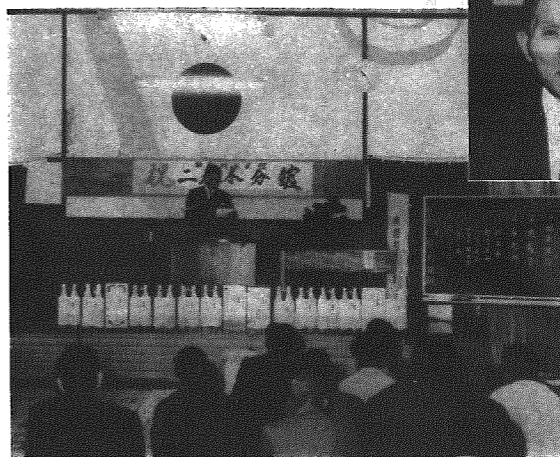
▲喜びにわいた開館式

これが教育委員会及び関係機関で審議検討の結果、分館を置くことが妥当とされたもので