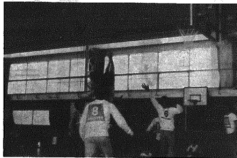
シュートの応酬が続く決勝戦

公民館と体育協会共催の第一〇一人の選手が出場し熱戦二回バスケットボール村大会を展開しました。三月七日横越小・中学校の伝統スポーツとなったバスケットボールは、体力づくりと親睦もさることながら、青少年の健全化のためにも伝統の灯は大切にしたいもの。