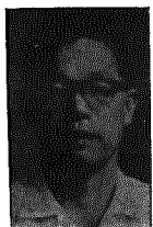
津正 三 山田 木

「あすなろ」が結成されたのは、今から二十二年前の昭和三十五年三月であった。結成当時の会員は七名であったが、その後会員の出入りもあり、現在は男三名女七名の計十名である。結成当時は小杉小学校を