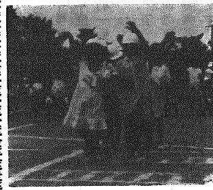
ハッキリ手をあげて

子供のいるご家庭では、ふだんから交通ルールをよく教えるとともに、朝学校に送り出すときは、次の点に十分気をつけましょう。 ◎出かけるときにしからなくない。 ◎忘れものをさせない。 ◎通学時間にゆとりをもたせる。 子供は、しかられるとこのことで頭がいっぱいになり、周囲の状況が目に入ら