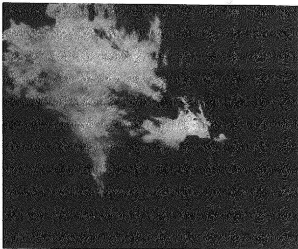
夜空をこがす火柱に歓声が上がる…… (小杉地区)

むかし子どもたちが大変な気があったという「賽の神行事」が、小正月（一月十五日）に各地で復活しています。村内でも青少年育成村民会議支部が中心となり、子どもたちに伝統的な行事を経験させて、郷土愛を培うため、一月十四日には二本木支部が同十五日には小杉、木津支部が賽