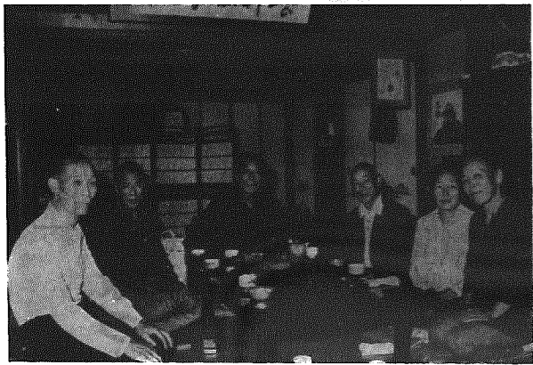
時どきこんなふう集まって 楽しいおしゃべりをしています

「生きがい」とひとことで いっても、これは老人だけの 問題ではありませんが高齢化社 会が急速に進む我が国では老 人の生きがい対策が大きな社 会問題となっています。