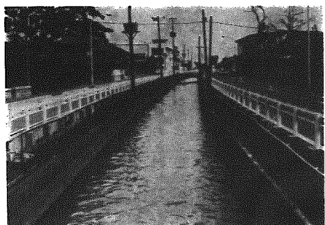
▲ 部落を流れる用水路

春耕期の訪れとともに農業用水路は、こん／＼と水を灌え、集落や市街地をぬって田園地帯へ導かれています。そして大地をうるおし、美