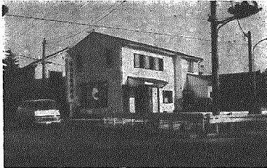
国道49号線にオープンした信組

昨年十一月から大字横越地内国道四十九号線沿いに建設工事が進められてきた新築信用組合の横越支店がこのほど完成し、三月十八日その竣工式がおこなわれました。この横越支店は信用組合としては八番目の支店にあたるもので、建物は木造二階建総床面積二七七平方メートルの洋風建物です。また、この横越支店は村の収納代理金融機関として税金などの公金を納めることが出来る金融機関になり