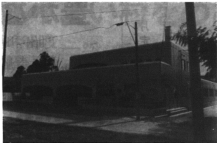
表面入口のモダンなアーチ式玄関

で、園児の定員も八十八人から百十人に増え、中央保育園に次ぐ規模になりました。 この建物の特徴は、表面入口がアーチ式になっており、玄関を入ると広々とした吹きぬけの天井で明るく、階段はラセン状、遊戯室は床下暖房と、モダンな感じのする保育園になりました。 ピッカピカの保育園は、四