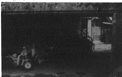
国道49号線ガード下に放置されているバイクや自転車

特に横越中の国道49号線ガード下では自動車も通れないような状態です。自転車の置き場所が放置されています。小学校跡地に新設された自転車小屋は横越バス停から約五十メートル位の近い距離にあり、利用しやすいように利用していただきます。