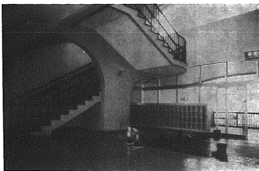
▲ 明るい吹きぬけの玄関とラセン状の階段