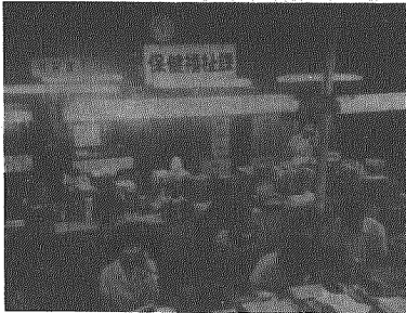
窓口と福祉部門の一元化を図った保健福祉課

役場では、七月二十一日付をもって機構改革と、これに伴う人事異動を行ないました。機構改革の内容は、従前の八課二局から、会計課を削減し、教委に事務局を設け、七課三局一室制にする。窓口、窓口、福祉、建設各部門の関連ある業務をそれぞれに統合一元化を図りました。これによって課の名称変更と、業務の移管も行ない新しい組織機構は、下表のとおりとなりました。 なお、今回の機構改革の特徴としては、従来企画課が担当していた都市計画、農村モラル、下水道等を建設企業課へ移し建設部門の一本化を、企画調整課へは職務課から広報統計を移し、企画調整を本来とする機能充実を、住民課へは従来の保健衛生