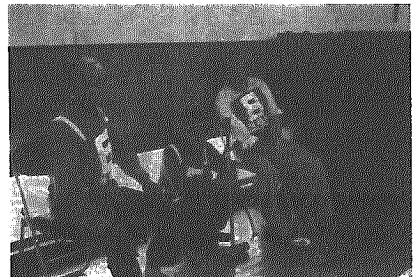
▲立ちくたびれてひとやすみだてばね

現在交付されている老人医療受給者証の有効期限が六月三十日までとなっており、七月一日から更新されます。そこで、左記のとおり忘れずに更新手続きをして新規の受給者証の交付を受けて下さい。