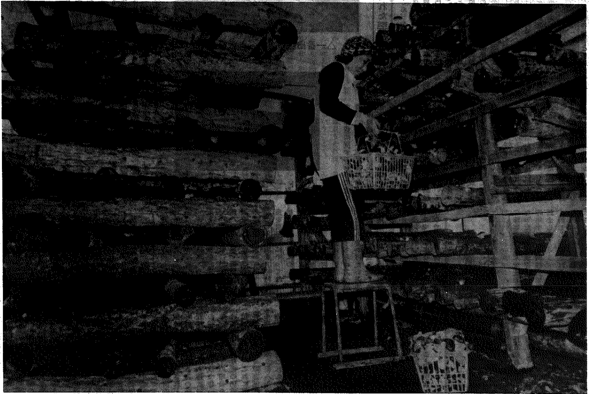
シリーズ村の特産 ① しいたけ栽培 横越(川根谷内) 風間憲男氏経営のハウス内で