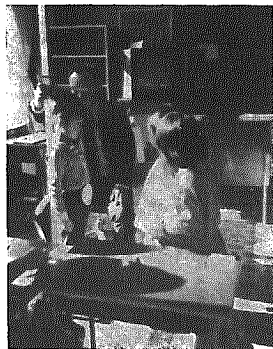
△はいアゴをひいて先生から身長をはかってもらう

去る十一月二十一日（水）横越小学校において、来年少小の健康診断が実施されました。この検査は学校教育法にもとずいて、村の教育委員会が実施するのを小学校に委託し行なわれたものです。 今回の診断項目は「耳鼻、咽喉、眼科、歯科、内科、視力、聴力、身長、体重」のほか、知能検査がおこなわれました。