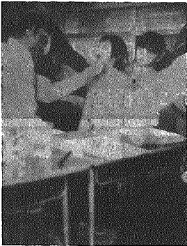
△口をいっぴいあけて元氣なかい子たち

来年の一年生は今年度入学をした子供達より二十二名多く百四十八名、男63名、女85名で一学級増の四学級になるそうです。この子供達も来年の二月には一日入学がおこなわれ、それまでに学級の組合せがきまるそうです。 今回の児童の身長はさまざまですが、一・一歳前後が普通のように、高い子では一二歳もありました。