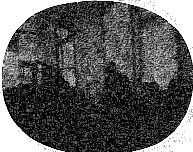
議会で予算説明をする村長

三月定例会が三月九日から十五日間の会期中開かれました。この中で昭和54年度一般会計予算、特別会計予算など二十議案が提出され、慎重審議の結果原案どおり決まりました。また、審議に先立ち「村政一般質問」がおこなわれ、村政全般にわたり、六人の議員から米の生産調整や道路問題など村政全般にわたる施設、施策がたどられました。