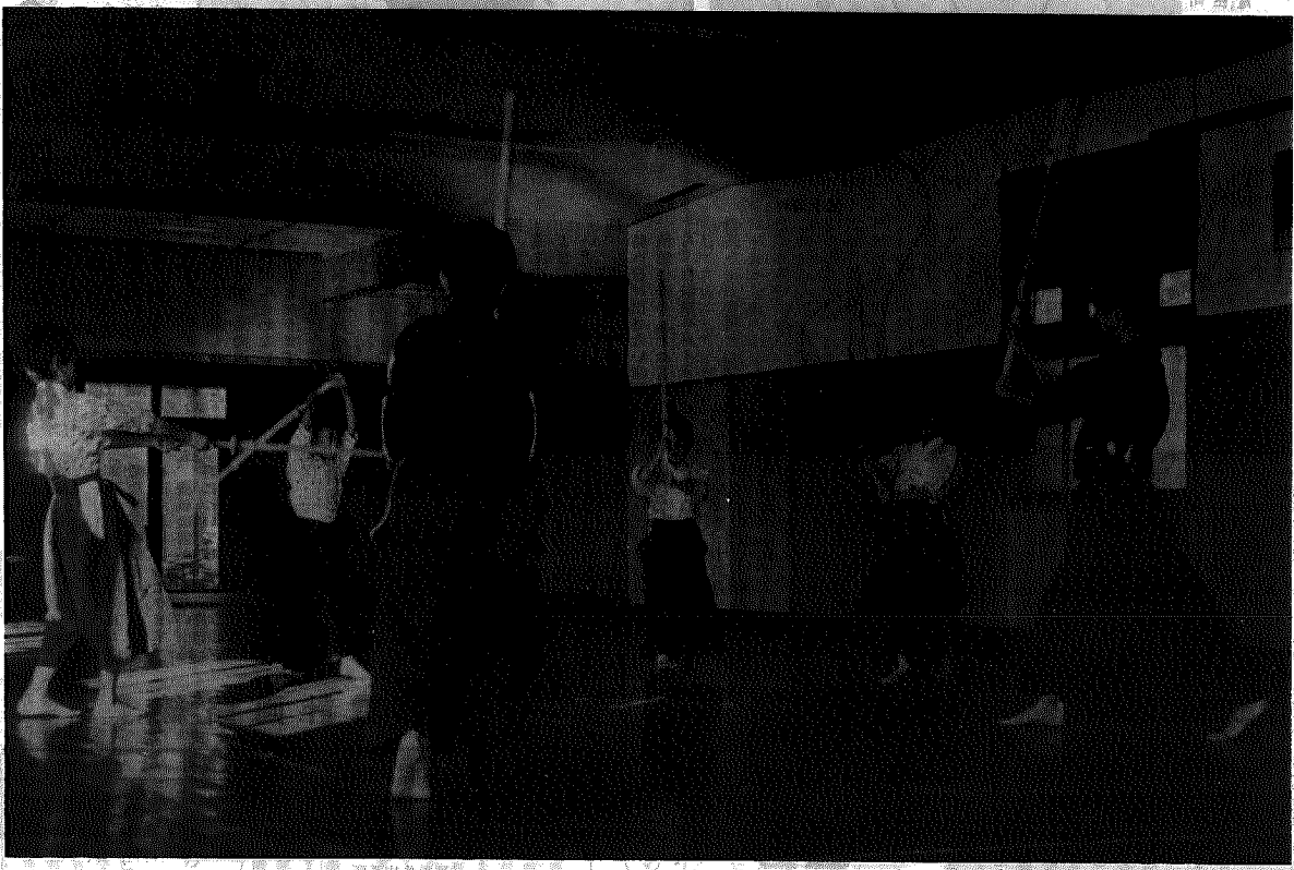
躍動シリーズ⑩ 剣道(スポーツ少年団)