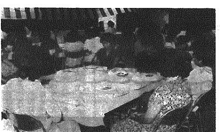
滝沢先生の話を受くしに聞く成人者

成人(は野郎だあー)としかられたこともありません。これからは一人一人が責任を持って行動し、社会に貢献していかなくてはなりません。成人式は、単に成人となるという儀式ではなく、社会に責任を持って行動する覚悟を新たにするための大切な日です。