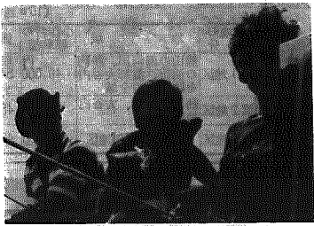
オブレイト家の両親とユットの上で