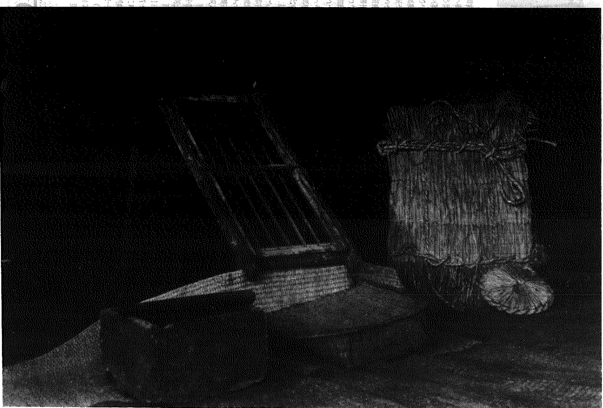
横越村民具資料 No.9 右から米俵、万石、下にあるのはみ、四角の一斗ます