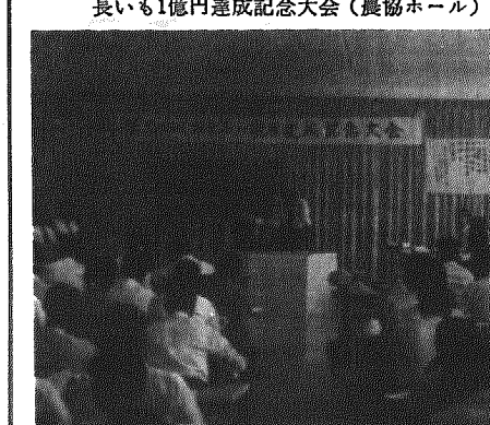
長い一億円達成記念大会(農協ホール)

県下では有数の野菜産地である沢海地区は、比較的盛んなる。その反対意見も加味して妥協するということが、ほとんどの民主政治とちがう。議会の意志は原則として多数決で定められる。民主政治における小党の存在理由を否定し、ひいては議会政治そのものを否定することになる。