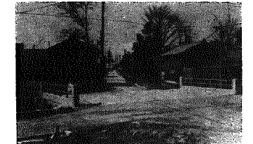
あやめ橋 統合小正門下手