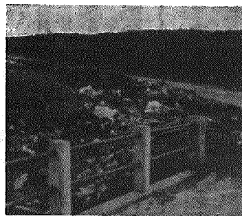
ゴミで汚れる環境

村では今年度からごみ収集車を四小車に切替へ、年々増加、多様化するごみに対して、決められた場所に搬出することを厳禁してまいります。