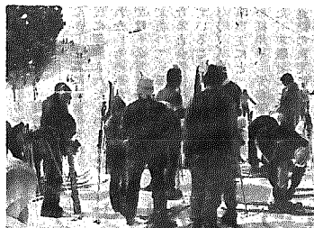
初心者には、まずスキーの歩き方から

村公民館 村体協では、 今後も定員を 多くして、家 族ぐるみ楽し めるスキー教 室と、スキー 以外にも村民 が一日楽しめる バスハイキ ングを計画し たいといっし りいる。