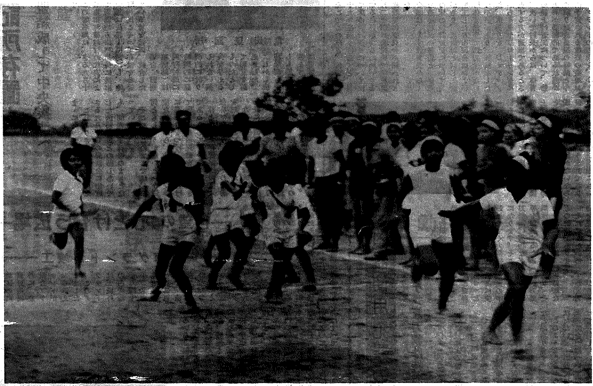
「おたごし」の手でつくった沢海グラウンド。 部落親善運動会 (S49.9.1)