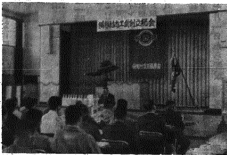
会員195名で商工会設立総会