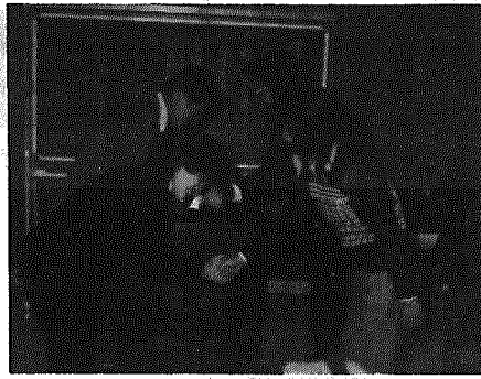
両町村青年団長のかたい握手で友情を誓う

かねて栃木県二宮町と交友、元青年と交歓研修会を行ったを深めていた横越村連青青年、連青一行二十四名と田中公団は二月九日から一泊三日、民館長は、九日午後二時、二の日程で二宮町を訪問し、地、宮町に到着、新装なった公民