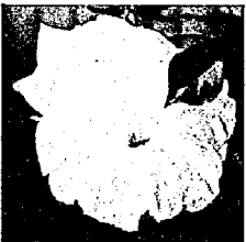
※参加者には大輪朝顔の苗を無料で差し上げます。

「おろし」を贈る集い 活動内容 茶の湯 活動日 第2・4水曜日 午前9時30分~正午 会場 公民館 申し込み・問い合わせ 活動日直接会場へ お知らせ 「おろし」を贈る集い 日時 6月27日(木) 午後6時30分~ 会場 新潟ふれ愛プラザ お問い合わせ 亀田おやこ ☎382-15234