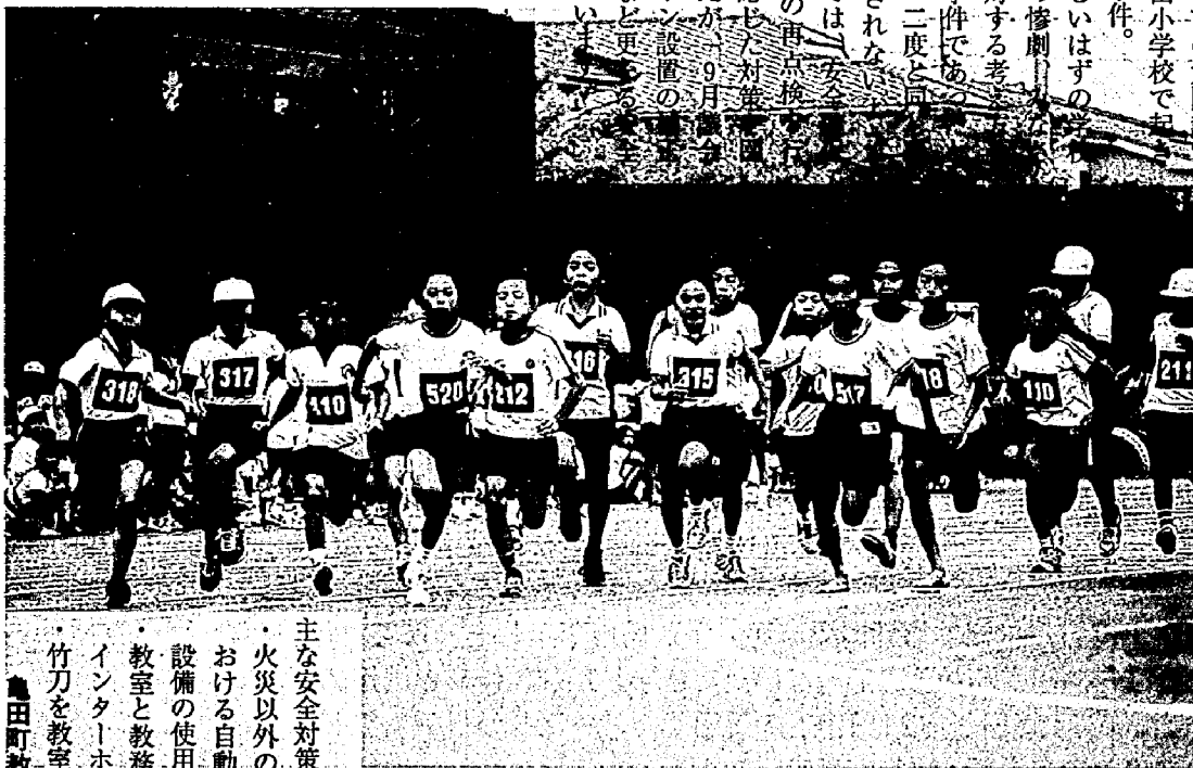
(本文とは直接関係ありません。9月19日 亀田郷体育祭より)

安全で楽しいはずの で起きたこの惨劇は、 んの安全に対する考 変えさせた事件であ 思われます。二度と同 件が繰り返されな 町内の学校では、 の観点からの再点検 い、実状に応じた対策 ってきましたが、9月 でインターホン設置の 要求を行うなど更に 対策を図っています。