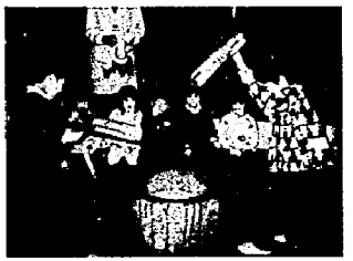
たのしいね! もちつきは

亀田カトリック幼稚園では、平成14年度園児募集を次のとおり行います。入園希望の方は、お早めに手続きをお願いいたします。 また、未就園児親子を対象に登園デー(なかよしエンゼル)を設けております。どうぞお気軽にご来園ください。 入園の資格 平成14年4月2日現在で満3歳以上の幼児、また年度途中で満3歳に達した幼児の入園についても、随時受け付けます。 募集人員 65人 申し込み 入園申込書(園に用意してあります)に手数料3,000円を添えて、11月1日(木)～30日(金)の間に申し込みください。入園案内や幼稚園要覧も