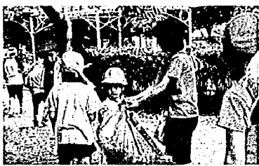
(東小フェスティバル)全校縦割り班で校区のごみ拾い。PTA環境部も協力。

「豊かな心」を当校では、次のように考えています。 ○自分は他人の親切や善意や協力、また、地域や自然の恩恵によって生きていくということを知る心 ○自分も周囲の人達や地域に貢献し、自分達の力で地域の環境や自然を守っていくことを自覚した心 ○苦しいことに負けない心 ○他人の立場を理解し、共に助け合っていく心 具体的な活動としては、児童会が中心になって行う