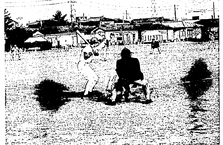
平成10年の予選リーグから