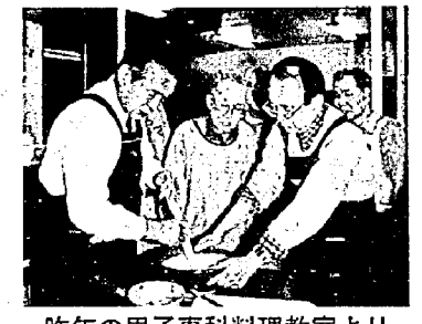
昨年の男子専科料理教室より

亀田町体育指導委員協議会では、誰でも気軽に楽しめるソフトバレーボール初心者教室を開催します。 日頃の運動不足解消のため一緒に汗を流しませんか。 開催日：5月12日~6月9日の毎週水曜日(5回) 午後7時~9時 会場：亀小体育館 持ち物：運動のできる服装と室内用シューズ、タオル。 申し込み：当日会場で行います。途中参加も可 問い合わせ：亀田町総合体育館・町民体育課 ☎381-1222