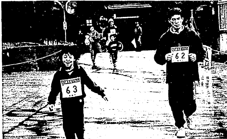
▲今年の元旦マラソン