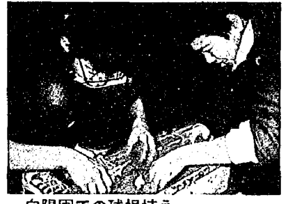
向陽園での球根植え

亀田小学校では、人や地域と関わる活動の中で、思いやり・奉仕の心を育てています。 一人一人が考えて行っている「全校奉仕活動(土曜朝)」は、自分の身の回りの整理・整頓から、次第に学級、学年、そして全校のための活動へと広がっています。「六年生の仲良し奉仕活動」では、六年生が、毎朝在校生に、明るく「おはようございます」の声をかけながら、学校中を清掃しています。 また、一年生から六年生までの構成でグループを作り、「縦割り清掃」「縦割り遠足」をしています。 「縦割り遠足」は、自分たちで目的地、活動内容を話し合いながら実施します。昨年は、電車やバスも利用して、田上のYOU遊ランドや新潟の海浜公園で活動したグループもありました。