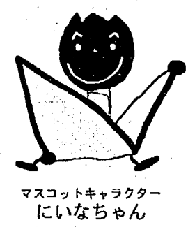
マスコットキャラクターにいなちゃん

8月1日から10月18日までの79日間、新潟市の県立鳥屋野潟公園と新津市の県立植物園において、花と緑の祭典「第15回全国都市緑化フェア」が開催されます。期間中は、いろいろなイベントが予定されていますが、8月8日(土)に亀田町の参加が決定しました。