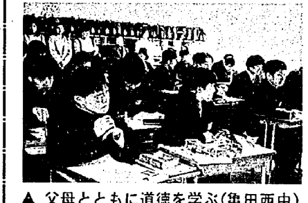
▲ 父母とともに道徳を学ぶ(亀田西中)