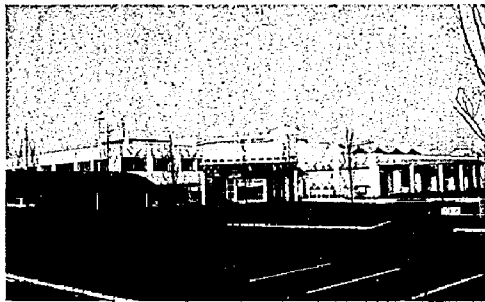
▲ 新潟ふれ愛プラザ