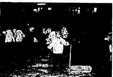
▲アイスリンクでのスケート指導

亀田カトリック幼稚園では、平成9年度の園児募集を次のとおり行います。入園希望の方は、早めに手続きをしてください。 ■入園の資格：平成9年4月2日現在で、満3歳以上の幼児 ■定 員：17人 ■募集人員：77人 ■申し込み：入園申込書（幼稚園にあります）に検定料5千円を添えて、11月1日(金)30日(出)までにお申し込みください。 ■入園の決定と通知：受付順に日時の案内に従って面接のうえ、即日入園の決定を通知し、手続きをしていただきます。 ※登・降園には、通園バスの利用、また所得に応じて保護者負担軽減の私立幼稚園就園奨励費補助金が受けられます。 ■問い合わせ：亀田カトリック幼稚園 ☎382-7766