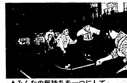
▲みんなの気持ちを一つにして

選手・応援登録者に保護者等も加わって 亀田町青少年育成町民会議では、町の未来を担う子供たちを対象に「ふれあい・なわとび大会」を開催します。 選手・応援登録者に保護者などの大人が加わってもかまいません。補導会、学級、ご近所などで子供たちを中心に編成し、気軽に参加してください。 ■と き：5月19日(日) ■午前9時～午後1時30分 ■ところ：アスパーク亀田内「亀田町総合体育館・メインアリーナ」 ■競技種目：長なわとび ■チーム編成：1チーム最低12人(まわし係2人)