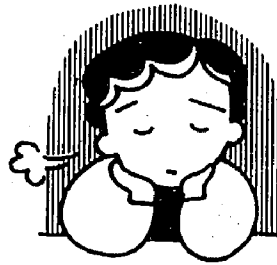
悩んでいるだけでは解決しません

【心の健康相談】 とき：二月二日(木) 午後一時から二時三十分まで ところ：保健センター 担当者：精神科専門医、精神衛生相談員、酒害相談員