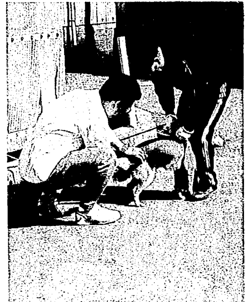
▲注射を受けるときは、 首をしっかり押さえるのがコツ

四月五日〜七日に町内一〇 か所で、「平成五年度・犬の 登録と予防注射」を行います。 これまでに登録していた方 は、お知らせのハガキを送付 しますので、必要事項を記入 のうえ、持参してください。 また新しく犬を飼い始めた 方は、左の日程をご覧ください。 直接会場におこしください。 《持参するもの》 ■手数料(1頭につき) ・登録と注射 四、九五〇円