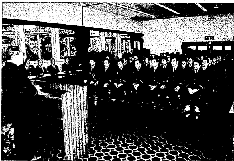
▲消防団の出初め式（公民館分館）

一月六日に、町消防団の出初め式が行われました。団員をはじめ関係者がそろって、いざというときに町民の生命財産を守ろうと誓い、また今年は無火災であるようにと祈願しました。恒例の放水演習も諏訪神社境内で行われ、青空に水のアーチがかけられました。