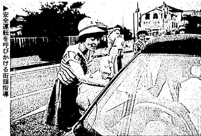
安全運転を呼びかける街頭指導

運転者にも車にも息抜きが必要です。終日運転しているドライバーには、「魂の抜けた状態」が一時間半の間隔を置いて現れる、といわれています。車だって長時間走り続けられ、エンジンやタイヤが熱くなり、故障しやすくなりますね。そこでちょっと一息入れたら、ドライバーも車もリフレッシュして、安全に運転することができず。一時間に一回を目安に、魂が抜ける前に休憩をとるようにしましょう。