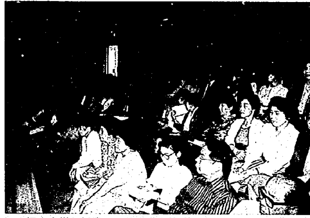
▲婦人大学が授業で6月議会を傍聴

●亀田町山の家設置条例を廃止する条例 津川町の山の家は、利用者が少ないため廃止しました。 ●亀田町議会の議員の報酬および費用弁償等に関する条例の一部改正 議員報酬(月額)を、議長二八八、〇〇〇円、副議長一