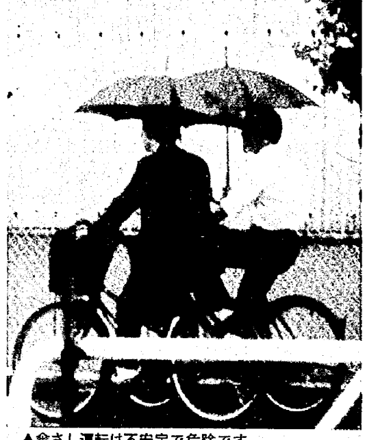
▲傘さし運転は不安定で危険です

そろそろ季節は梅雨。これから長雨や、ジメジメした高温多湿の日が続く、不快感が高くなっています。 こんなとき、雨が直接・間接的に原因となった交通事故が多発します。とくに、二輪車・自転車の事故が多くなる傾向です。雨の影響を考え、梅雨どきの交通事故防止に努めましょう。 ■絶対やめたい、傘さし運転 雨の日、傘をさしながら自転車を運転する人がめだちます。とくに、通勤・通学の人が多いようです。傘をさすとハンドルを握るのは片手。それでは安定した走行ができず、 また前輪や後輪だけのブレーキでは、転倒する危険があります。雨の日は雨がっぱを着るか、少し時間の余裕をみて歩くようにしてほしいですね。 ■雨の日は視界が狭い 車を運転する人は、路面が濡れていると制動距離が延びることをご承知でしょう。とくに降りはじめは、滑りやすいうです。 またワイパーが作動したり、ガラスの曇りで視界が狭くなり、安全確認が大切です。夜間はライトの反射もあり、歩行者の姿も見落としがちですので注意してください。 雨の日は、速度は控え目、