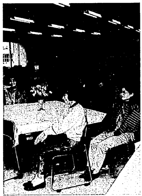
▲婦人大学のみなさん

公民館では、平成四年度の福寿大学・婦人大学の学生を募集します。生涯学習の時代といわれている今、視野を広げるには最適な場ではないでしょうか。授業には多彩な講師を招き、学生のみならずから好評をいただいています。 希望する方は、次のようにお申し込みください。 「福寿大学」 満六〇歳以上の方は、どなたでも入学できます。 希望する方は、三月三十一日(火)までに福寿大学役員または公民館へ、運営費千円を添