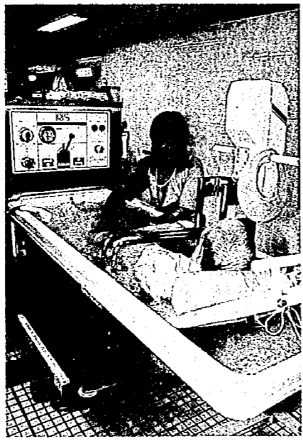
▲「かんばらの里」では、明るく元気な職員がお世話してくれます。

お年寄りのお世話をしている方が病気で事故のとき、または冠婚葬祭などの行事があるとき、介護疲れを回復したいとき、旅行にでかけるときなど、老人ホームで一時的に、お年寄りを預ります。