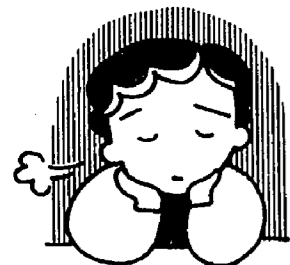
悩んでいるだけでは解決しません

◆転出先では： 前の住居地からの転出証明書と印鑑を持ち、転入先の役場へ。国民年金に加入している方は年金手帳、就学前のお子さんがいる方は母子手帳も持参してください。