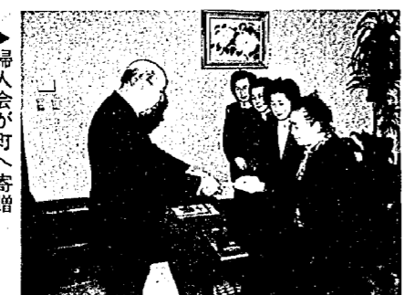
婦人会が町へ寄贈