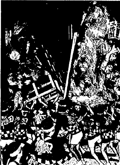
▲今年は足利尊氏と楠木正成がぶつかり合う（写真は昨年のも）

八月二日に行われた亀田甚初大民謡流しをはじめ、袋津燈籠、大岩万燈と、亀田の伝統行事の様子がテレビで放映されます。みなさんも画面に映るかも知れません。どうぞお見のがしなく。●と き：九月一日（日） 午後五時～五時三十分 ●放映局：五チャンネル（BSN）