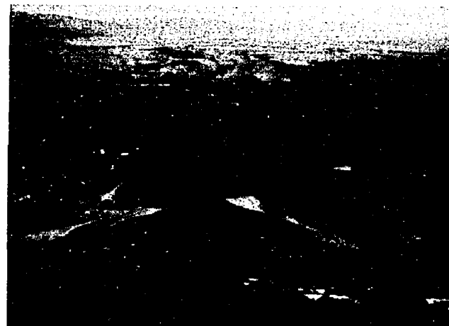
▲蒲原平野を流れ、日本海に注ぐ阿賀野川。いく度の水害を乗り越え、より安全を求めて治水対策が施されてきた

またこのほか、地形の横断面の模式図、過去の洪水状況の建物写真を使った河川水位の説明も表示しています。阿賀野川流域の氾濫区域図では、亀田町全町が水位との高低差五割以上の区域に表示されています。ただしこれは、