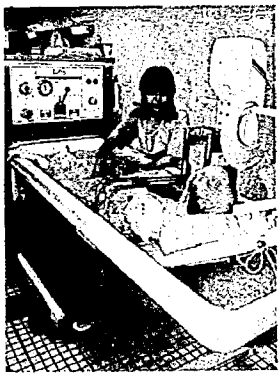
▲デイ・サービスセンターでは入浴や食事、機能訓練などが行われる（かんばらの里）

議員：急速な高齢化、扶養意識の変化、寝たきり老人介護等、老人福祉ニーズは複雑多様化しています。そこで、体の不自由な在宅老人をお預かりする、デイ・サービスセンターを設置することが急務と考えます。町長の所見は。